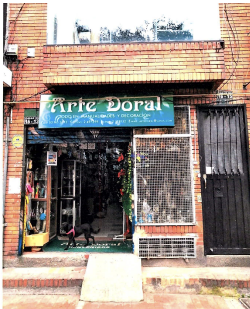
Foto actual octubre 12/2020 de fachada

Esta prueba es inconducente , puesto que no es el medio idóneo para controvertir los hechos constitutivos de infracción ambiental que dieron origen al incumplimiento de normas de carácter ambiental, que para el presente caso ameritó el inicio del procedimiento sancionatorio, toda vez que si bien demuestra la existencia de un elemento de publicidad, esta evidencia fotográfica no permite demostrar que el elemento de publicidad exterior visual cuente con registro ante la Secretaría Distrital de Ambiente.